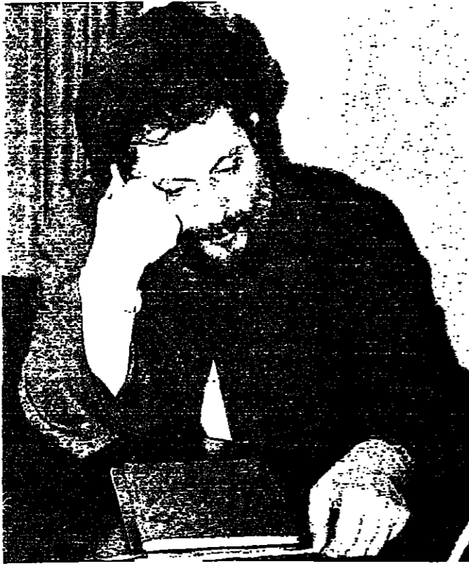
مساحة الامام الصدر: تحذير من احتلال الجنوب (تصوير اسماعيل حداد)

سامات المحنة - بلال ، كان الرئيس الراحل الجنرال يقول قد أكد ان فرنسا ان تصف حكومة اليريد اذا اعنت اسرائيل على لبنان بنسبة الاحتلال . والرئيس الراحل بومبيديو ايضا ، اقر ايديا واكد الالتزام . من الضروري إعادة الكرة ، والطالب من الرئيس جيسكار ديستان ، والبيت في تفاصيل هذا الالتزام ، الذي اصبح اكثر الحاحا من ذي قبل . كما ان هناك الاتهامات اخرى من دول عربية واسلامية ، ودول العالم الثالث والدول الاشتراكية وحتى بعض الدول الكبرى .